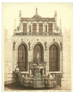
Dwór Artusa z Neptunem